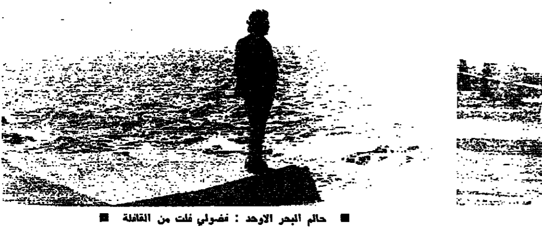
حالم البحر الورد : فضولي فلت من القافلة